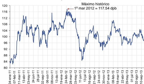
Precio de la mezcla mexicana de exportación Dólares por barril, 2011-2013